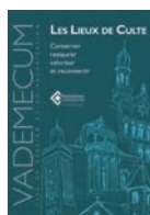
Collection Vademecum n°3 3 e trimestre 2017, 48 pages - 5,00 €