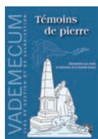
Collection Vademecum n°2 2 e trimestre 2015, 40 pages - 5,00 €