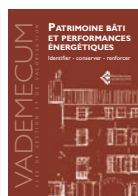
Collection Vademecum n°4 1 er trimestre 2019, 48 pages - 5,00 €