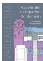
Collection Vademecum n°1 2 e trimestre 2010, 40 pages - Épuisé

L'objectif de ce Vademecum est de démontrer qu'il est possible d'éclairer intelligemment, tout en mettant en valeur le patrimoine bâti ou paysager.