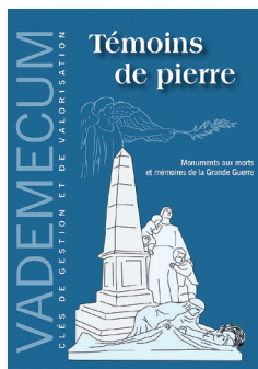
Édition Patrimoine RhôneAlpin Collection Vademecum n°2 2 e trimestre 2015, 40 pages - 5,00 €