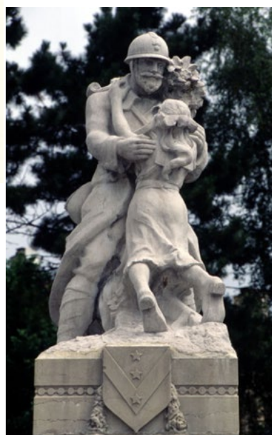
Le monument de Meximieux.