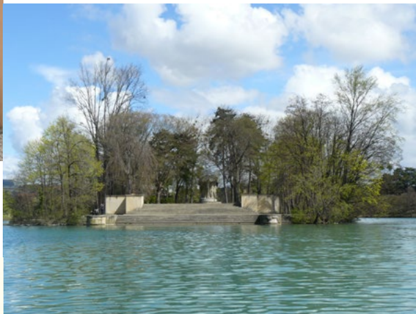
L'Île du Souvenir au milieu du lac © L. Hamonière.