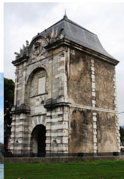
La Porte de France