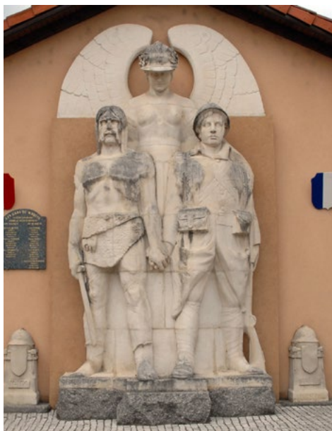
Le monument de Boën (Loire)

Pour vous procurer une illustration, contacter Patrimoine Rhônalpin pra@patrimoine-rhonalpin.org