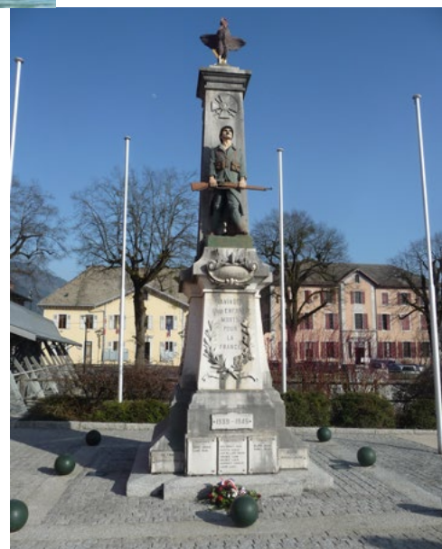
Le monument de Taninges pour 1914-1918