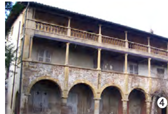
© Association du Petit Perron 4

70 rue Philippe de Lassalle, 69004 Lyon, 06 09 44 92 26, graven.c@9business.fr