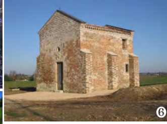
© Les Amis du site 6