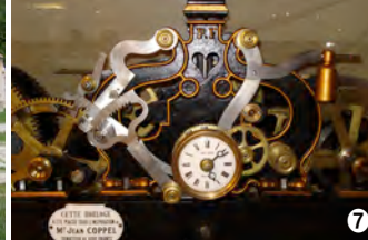
© Musique mécanique des Gets 7

Mention : Association Concordia (Délégation régionale) ②