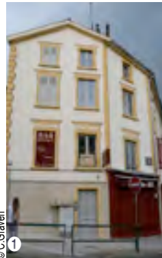
© C. Graven 1 Façade en trompe l'œil Villefranche- /Saône