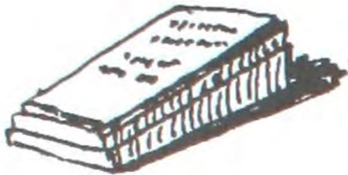
Des dalles horizontales