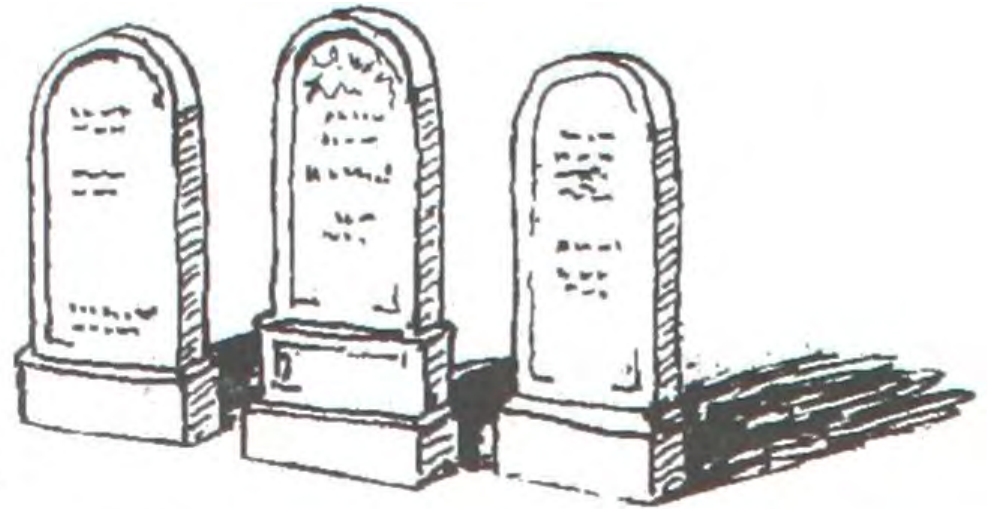
Des stèles arrondies