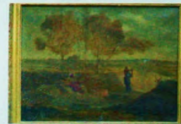
Le Christ et la Samaritaine - huile sur toile