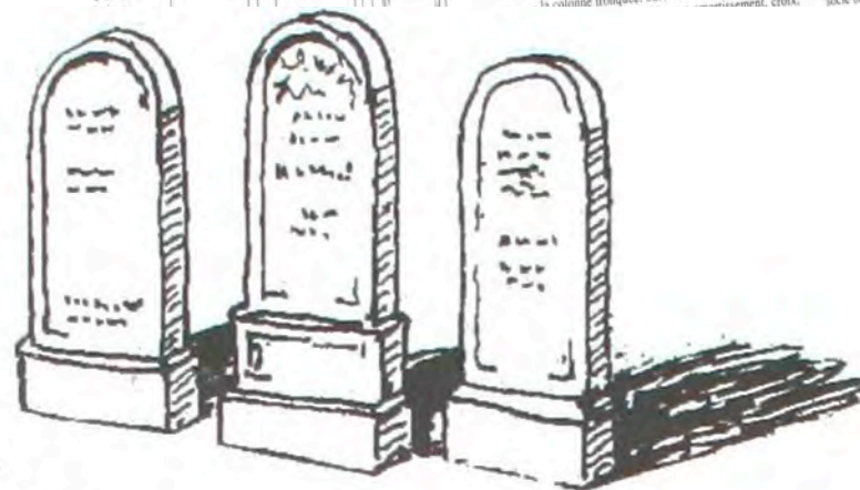
Des stèles arrondies