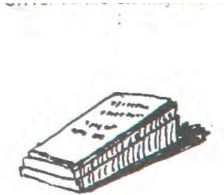
Des dalles horizontales