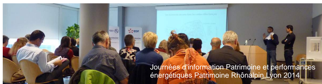
Journées d'information Patrimoine et performances énergétiques Patrimoine Rhônalpin Lyon 2014