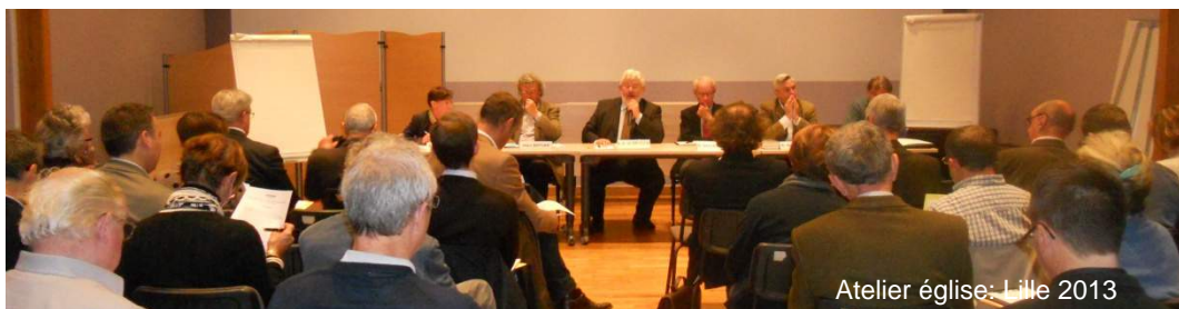
Atelier église: Lille 2013