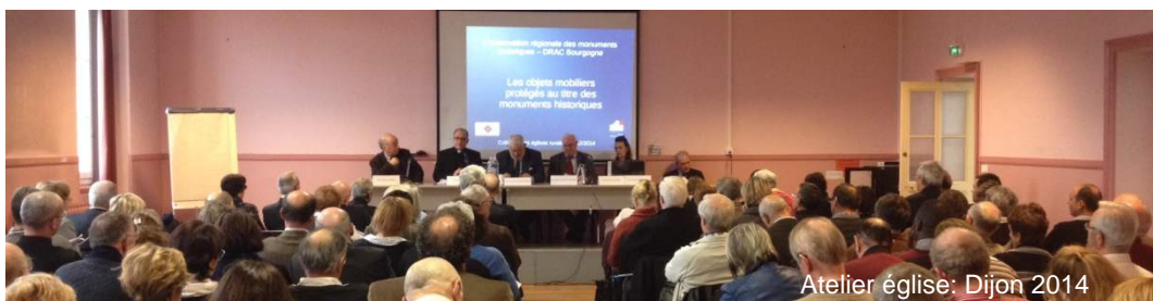
Atelier église: Dijon 2014