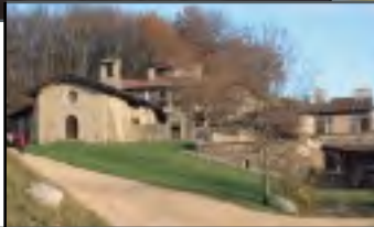
Notre-Dame de Parménie, à Izeaux (Isère) un site naturel et historique remarquable de la région Rhône-Alpes.

Située dans le Dauphiné, sur la commune d'Izeaux, Notre-Dame de Parménie a d'abord accueilli une chartreuse de moniales. Détruite en 1391, elle a été, entre autres, centre de retraite au XVII e siècle et a servi de refuge aux maquisards pendant la seconde guerre mondiale.