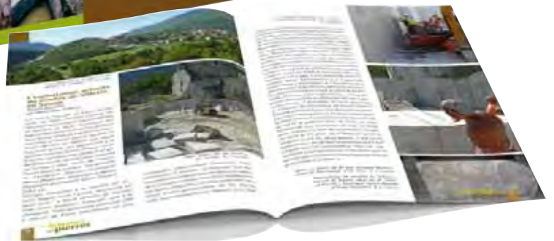
Illustration disponible en fichier jpeg à demander à livres@mg-editions.com