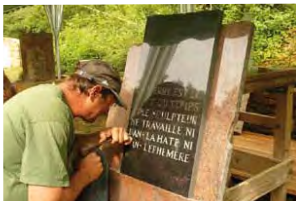
Un graveur sur pierre au travail (carrière de Glay, fête de la Pierre 2010).