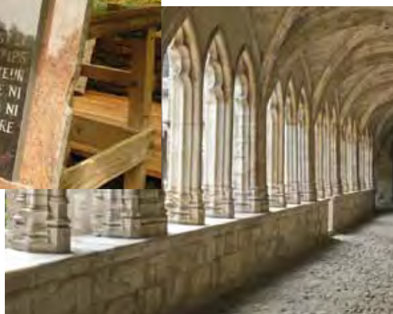
Cloître de la cathédrale de Saint-Jean-de-Maurienne.