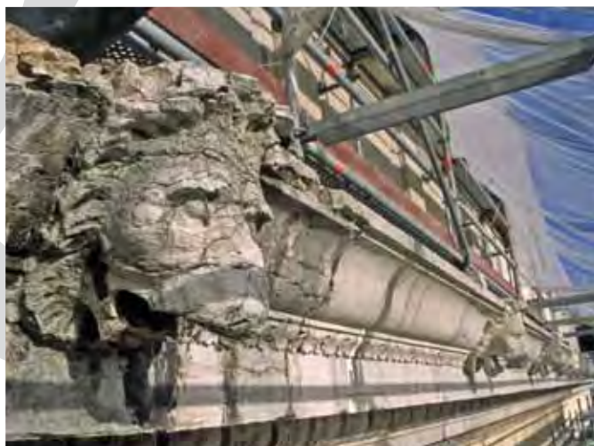
Fronton du palais de justice de Lyon avant travaux.