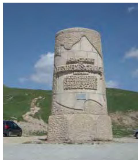
Si le monolithe de Villebois est le plus haut monument par la taille, le plus haut en altitude est le monument à Henri Desgranges (créateur du Tour de France), construit en choin de Villebois à proximité du col du Galibier (2 500 m).